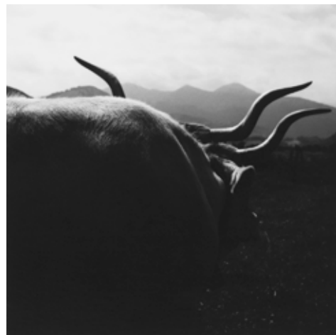
Chrystèle LERISSE 044-006