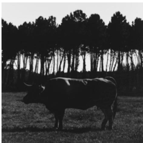
Chrystèle LERISSE 044-002