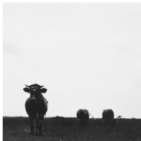
Chrystèle LERISSE 044-003