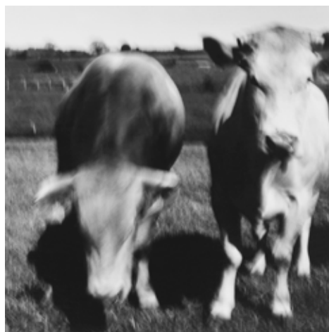
Blonde d'aquitaine 3