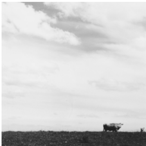
Chrystèle LERISSE 044-005