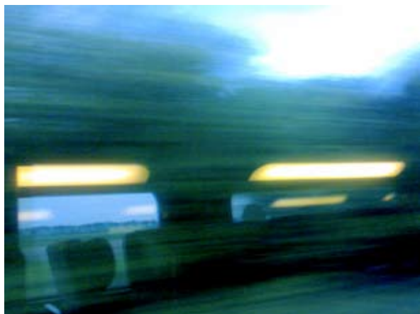
Louis Sclavis - 001

Références des images disponibles en haute définition