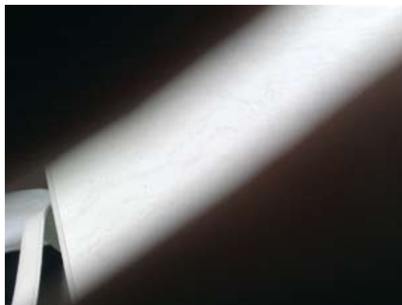
Louis Sclavis - 002